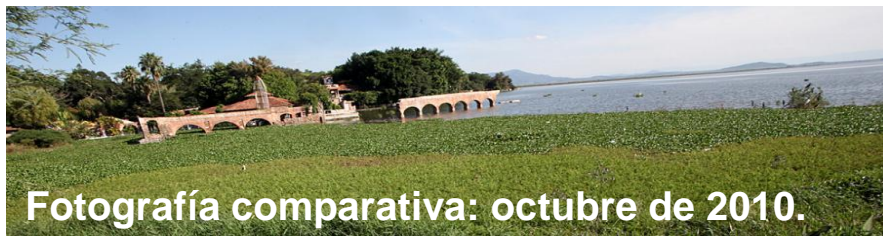
Fotografía comparativa: octubre de 2010.